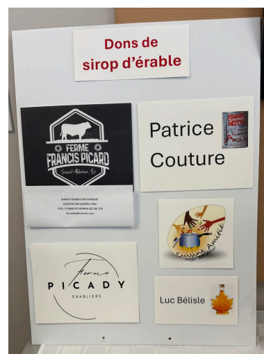
Merci à nos généreux donateurs de sirop d'érable