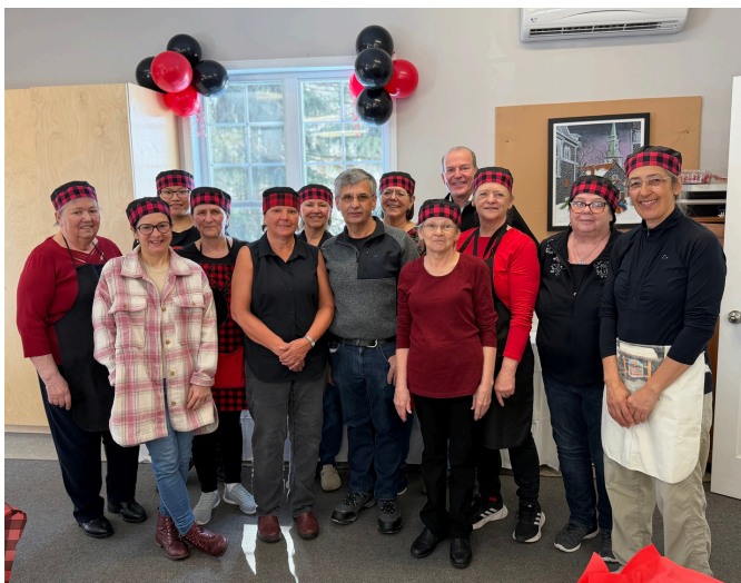
Les dames bénévoles de la cuisine collective, le maire, Serge Bernier et le député, André Bachant